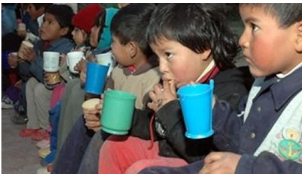
Debido a la crisis se triplicaron los comedores comunitarios.

Según el documento, el altísimo porcentaje de obesidad "es una característica de la malnutrición en los sectores populares" , donde la imposibilidad de comprar alimentos nutritivos como carne, vegetales y lácteos, lleva a consumir mayormente hidratos de carbono como lo son el arroz, las harinas y los alimentos con alto contenido graso, gran contenido calórico y de muy bajo valor nutricional.